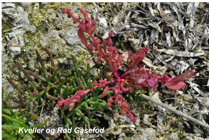
Kveller og Rød Gåsefod