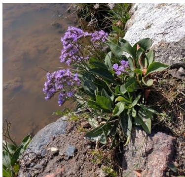
Tæt blomstret Hindebæger Vokser bl.a. på strandengen ved Vejlen på Reersø

Tilmeld dig til maillisten for oplysning om næste tur: merete2gertz@gmail.com