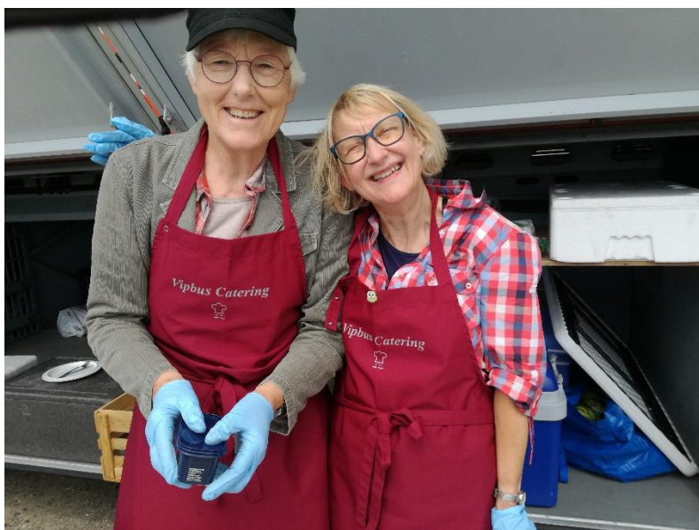
De søde serveringsdamer fra Vipperød catering

Smelt smørret og rør det sammen med sukker, æg og vand. Bland mel, salt, bagepulver og vaniljesukker og rør det grundigt i dejen. Rør havregrynene i. Sæt klatter på størrelse med en valnød på bagepapir. Bages i 12-15 min. ved 180 gr. på over/undervarme.