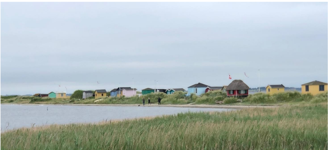
Erikshale med de fine små badehuse