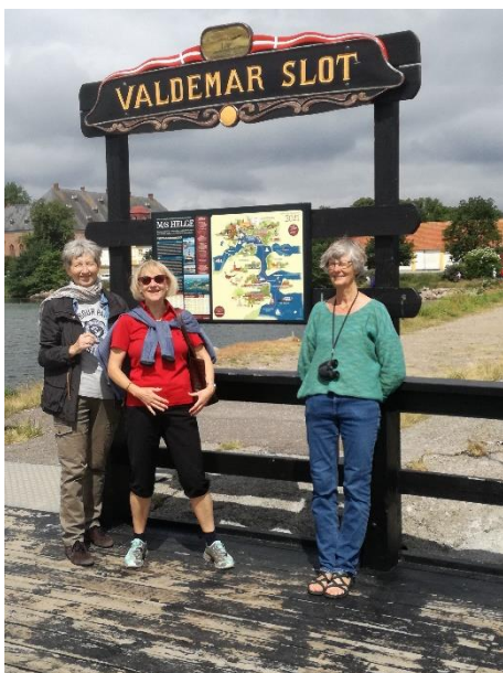
3 tøser poserer for fotografen